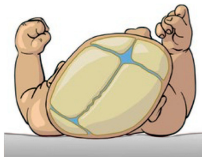
Nieprawidłowa i asymetryczna czaszka

Czaszka dziecka jest bardzo miękka i rozciągliwa. Jeśli dziecko zazwyczaj śpi z główką zwróconą w tę samą stronę, czaszka będzie bardziej płaska po tej stronie i kości głowy również się zdeformują. Zdeformowane kości głowy często wpływają negatywnie na ruchy szyi.